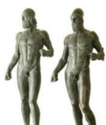
I migranti di Riace

Dopo un complesso lavoro di restauro nei laboratori fiorentini, le due statue furono presentate al pubblico, prima a Firenze e a Roma e poi al museo di Reggio Calabria ove sono esposte.